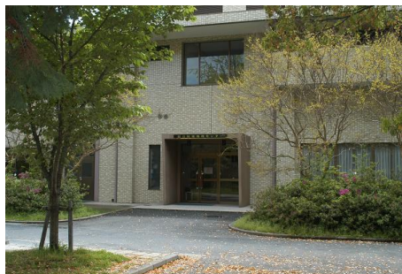
図1 総合情報処理センター

学外に対しての接続いわゆるインターネット接続は大阪地域大学間ネットワーク（ORIONS）を経て 2000年より学術情報ネットワーク（大阪大学内 SINET ノード）へ接続し、2003年2月より 100Mbps Ethernet（同志社大学内 SINET ノード）に増速され、今後のマルチメディア情報へのアクセスへの対応を可能としている。また近隣の国立機関・県立機関・私立大学との専用回線接続により SINET の NOC としての役割をも担っている。